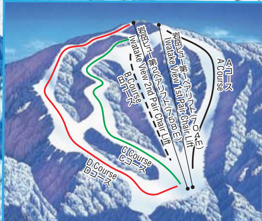
Iwatake resort view skiing slope 岩岳リゾートビューゲレンデ The skiing slope which spreads in a summit-of-the-mountain reverse-side 山頂裏側に広がるゲレンデ